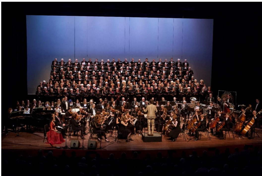
Con Brio en Ettens Mannenkoor op 13 februari 2016 in Amphion

Proef de Ettense koren, dan pas weet je hoe leuk het is! Als je mee wil doen of als je meer informatie wilt dan kan je contact opnemen met via conbrioetten@gmail.com of info@ettensmannenkoor.nl