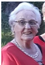
Ingezonden stukjes door Wilhelmiën